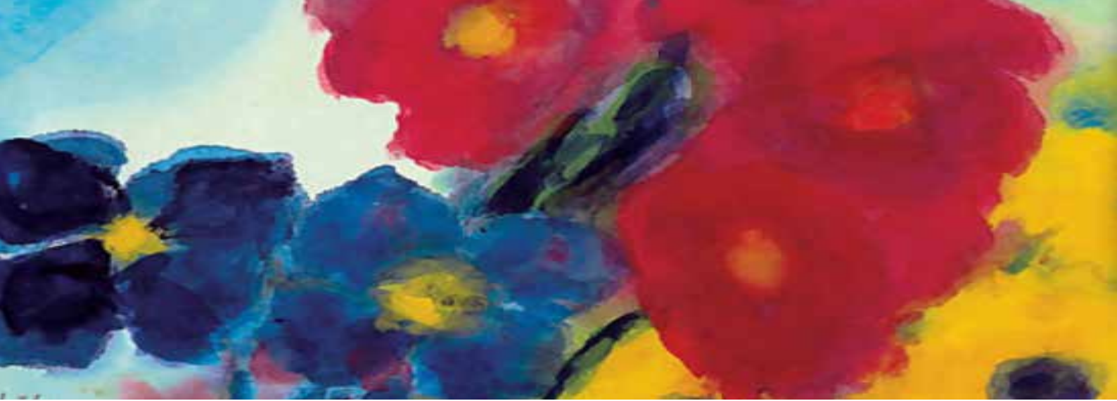
beeld: Emil Nolde

Uit diepten van ellende / roep ik tot U, o Heer. Gij kunt verlossing zenden, / ik werp voor U mij neer. O laat uw oor zich neigen / tot mij, tot mijn gebed. Laat mij gehoor verkrijgen, / red mij, o Heere, red !