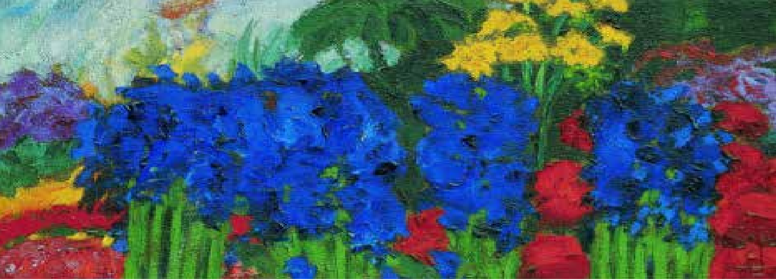
beeld: Emil Nolde

Misschien speelt het leven van een mens zich wel af tussen de uitersten van het gedicht Een geschenk van de Poolse dichter Czeslaw Milosz (1911-2004) en de eerste verzen van de dichter van Psalm 130.