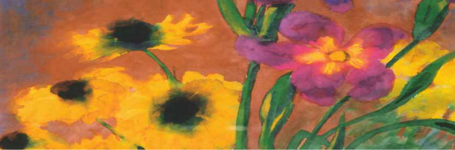
beeld: Emil Nolde

Hiermee had ik moeten beginnen: de hemel. Een raam zonder vensterbank, kozijn of ruiten. Een opening en niets daarbuiten, maar wijd open.